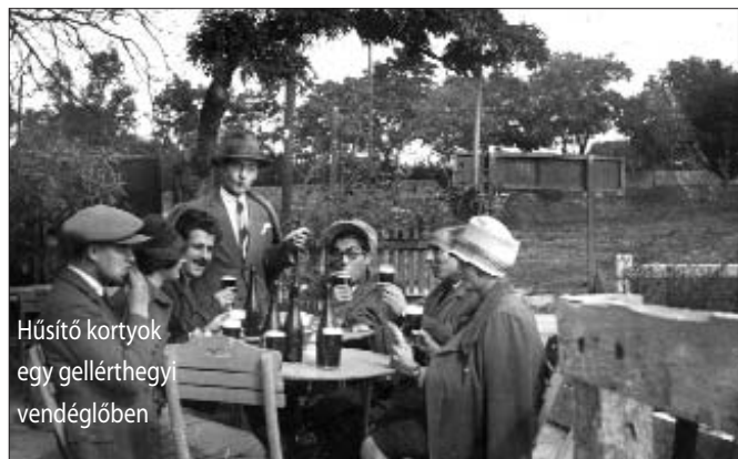
Hűsítő kortyok egy gellérthegyi vendéglőben

Leegyszerűsítve két nagy, de egymással összefüggő problémakörrel kellett foglalkozniuk. Abból indultak ki, hogy a Gellért-hegyet a beépített területei sorába illesztő főváros a lakónegyed kialakításán túl, a nagyközönség számára is birtokba vehető, magas színvonalú, parkosított zöldövezetet is kapjon. A Szent Gellért-hegy Barátainak Egyesülete ezért – ahogy az a fennmaradt éves munkabeszámolókból kitűnik – sziszte-