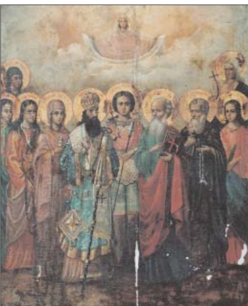
Ismeretlen festő: Mária kiválasztott szentekkel ikon, 1884, olajkép, vászon, fatáblahordozón

A restaurált, kész állapot. Az esztétikai helyreállítás beilleszkedő olajgyanta retussal készült.