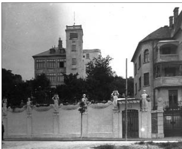
Elegáns villák a város felett, Orom utca 8-10.

Szent Gellért-hegy Barátainak Egyesülete néven megalakították a következő két évtizedben igen jelentős és eredményes munkát végző érdekképviseleti szervezetüket. Az Egyesület tagjai sorában olyanokat találunk mint az egyik alapító, Plósz Sándor (1846–1925) jogász, egyetemi tanár, az MTA tagja, igazságügy-miniszter, aki számos alapvető polgári jogintézmény megalkotója volt vagy Schafarzik Ferenc (1854–1927), a műszaki földtan és hidrogeológia