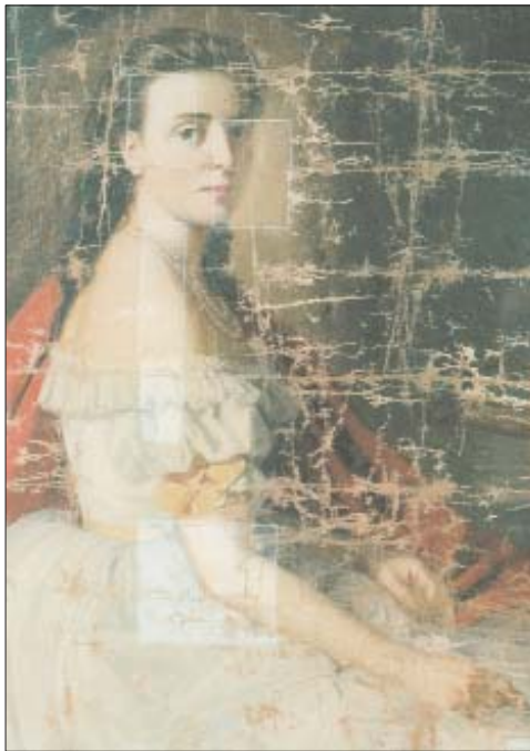
Ismeretlen festő: Női képmás olaj, vászon, XVIII. század