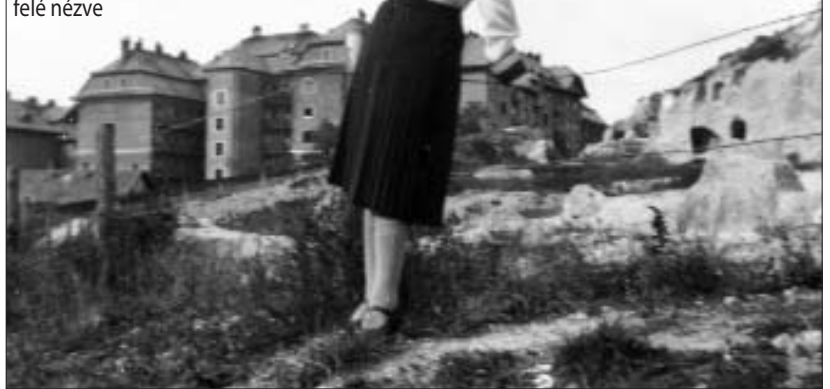
A Kis-Gellért-hegy, az egykori kőbánya felől a Schweidel utca felé nézve

Az elmondottak érzékeltethetik, hogy a Gellért-hegy alapos, értékszempontú revitalizációra szorul. Ez pedig helyi, fővárosi és országos ügy is egyszerre. A kivételes egységet alkotó városrész rangjának megfelelő kezeléséhez elengedhetetlen a létrejöttéhez vezető út