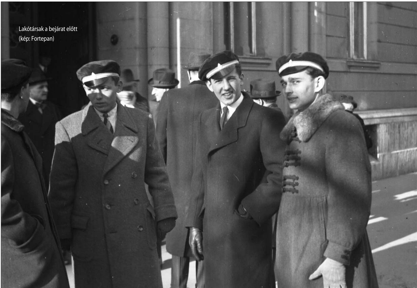
Lakótársak a bejárat előtt