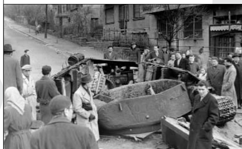
Szovjet tank foszlányai a Himfy utca-Körtér találkozásánál

Cikkünk szerzője művelődéstörténész, a Varsói Egyetem tanára, József Attila-díjas író, 15 önálló könyve látott napvilágot. Az egykori József Attila (most Szent Imre) Gimnáziumban érettségizett 1963-ban, szűkebb hazája a Szentimreváros. Szenvedélye a csavargás az Adriától a Balti-tengerig.